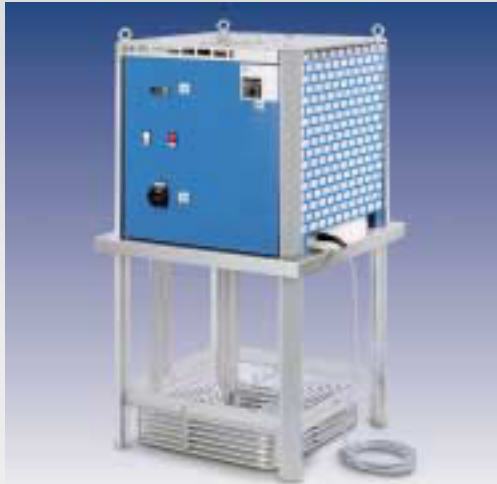
TRK - Eintauch-Rückkühler für Kühlschmierstoffe mit einer Kühlleistung von 2 bis 70 kW. Servicefreundlich in Wartung und Reinigung.