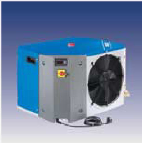
CHILLY - Kühlwasser-Rückkühler mit einer Kühlleistung von 0,2 bis 4,5 kW mit Tank und Pumpe. Platzsparend und zuverlässig.

Die preiswerte Alternative für Anwendungen mit höheren Wassertemperaturen.