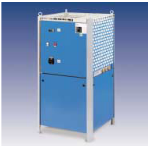
VWK/1 - Kühlwasser-Rückkühler mit einer Kühlleistung von 2 bis 15 kW mit Tank und Pumpe. Kompaktbauweise mit hoher Temperaturgenauigkeit.