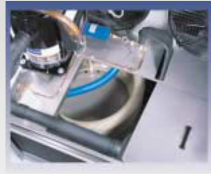
Verdampfer-Tankeinheit mit Hilfe des Deckels leicht von oben zugänglich