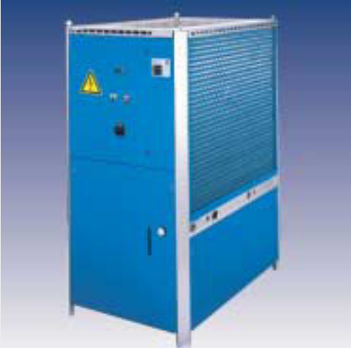
SVK - Kühlwasser-Rückkühler mit einer Kühlleistung von 15 bis 70 kW mit Tank und Pumpe. Kompaktbauweise mit hoher Temperaturgenauigkeit.