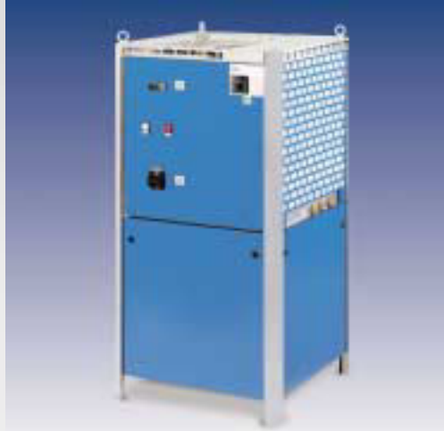
VWK/1 - Kühlwasser-Rückkühler mit einer Kühlleistung von 2 bis 70 kW mit Tank und Pumpe. Kompaktbauweise mit hoher Temperaturgenauigkeit.