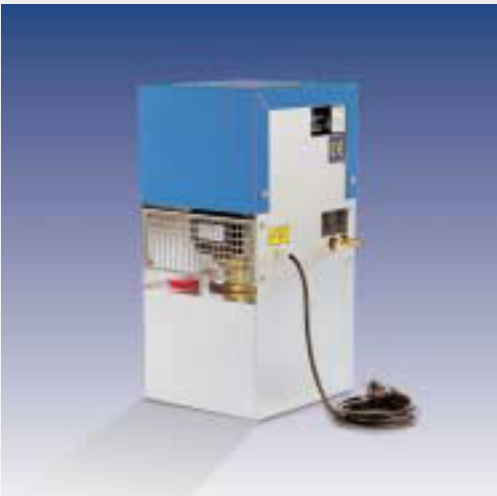
LWK - Luft-Wasser-Kühler ohne Kälteaggregat mit einer Kühlleistung von 2 oder 2,5 kW mit Tank und Pumpe.

Die preiswerte Alternative für Anwendungen mit höheren Wassertemperaturen.