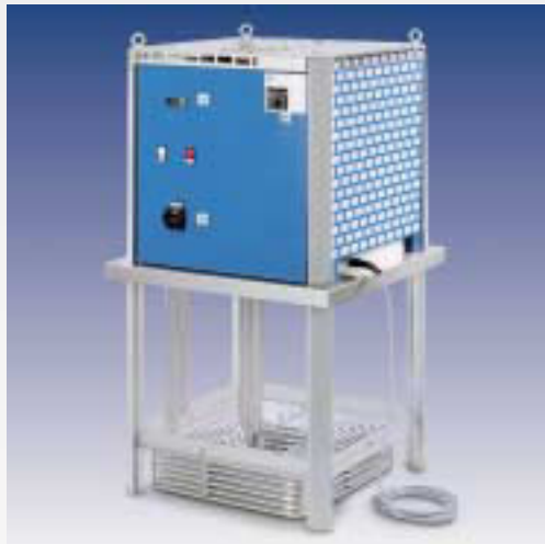
TRK - Eintauch-Rückkühler für Kühlschmierstoffe mit einer Kühlleistung von 2 bis 75 kW. Servicefreundlich in Wartung und Reinigung.

Die preiswerte Alternative für Anwendungen mit höheren Wassertemperaturen.